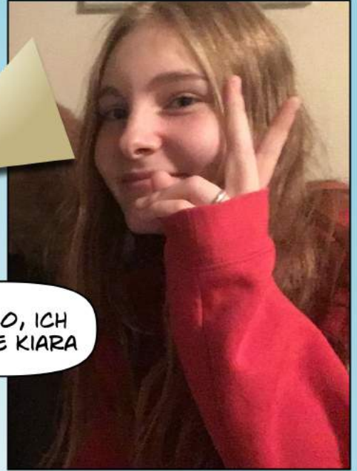
KIARA ARRIVE CHEZ ANNA